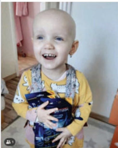
Agátčina nefalšovaná radost :-) Nadační fond Šance onkoláčkům

U Bedřichova se 7. února 2020 konal už 53. ročník slavného závodu Jizerská 50 v běhu na lyžích. Při té příležitosti jsme zahájili spolupráci s největší českou zdravotní pojišťovnou VZP s konečným cílem umožnit co největšímu počtu lidí nákup našich výrobků za zvýhodněné ceny. Koronavirus tuto spolupráci pozdržel, plně se rozběhla až v srpnu. Závodníci z řad VZP, sdružení v Klubu pevného zdraví, nicméně už při únorovém závodě vyrazili na trať s našimi nanovláknými šátky R-shield. Ty je chránily nejen před chladem, ale i před rizikem infekce při velké koncentraci lidí na jednom místě.